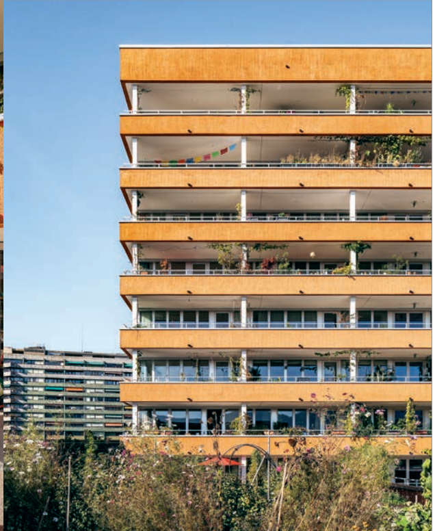
Les coursives et les jardins locataires démultiplient les appropriations.