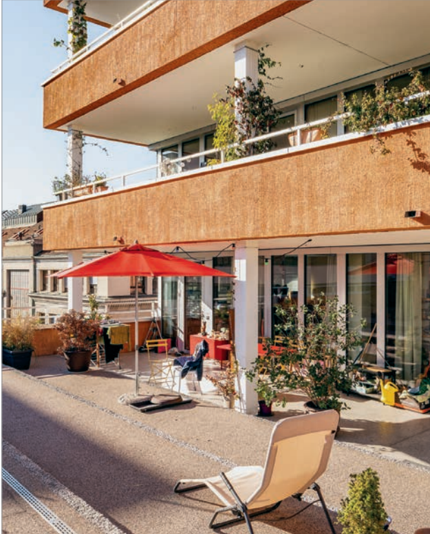
190 Toutes les toitures terrasses sont utilisées pour créer des espaces extérieurs collectifs diversifiés.