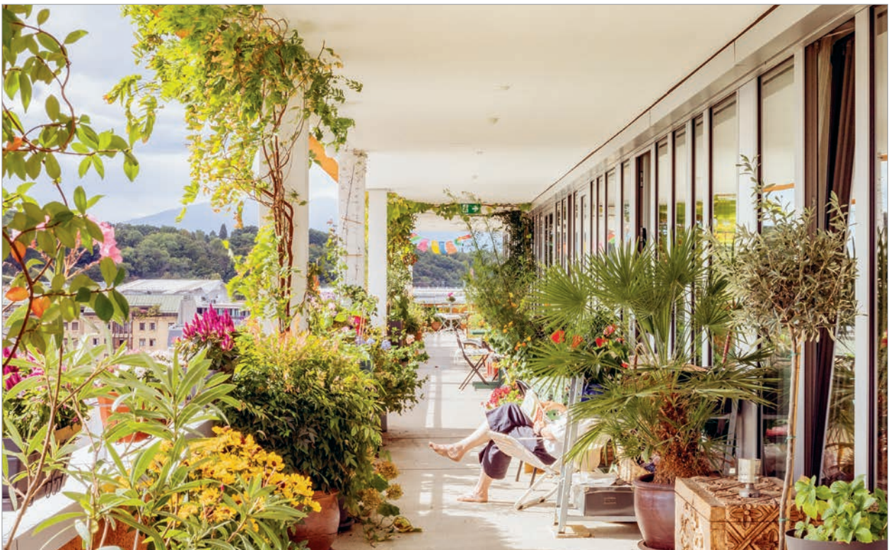
194 Les coursives fonctionnent simultanément comme distribution des appartements et comme balcons.