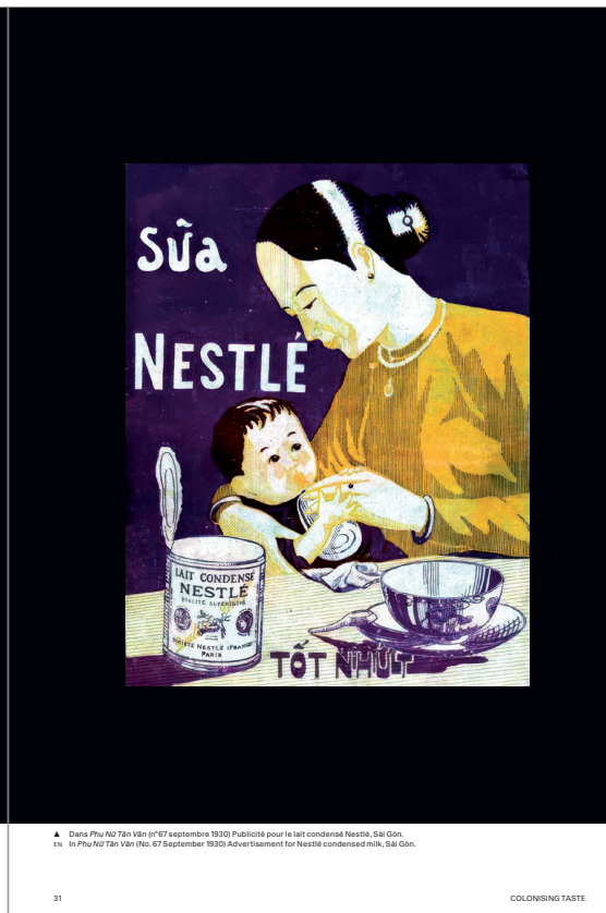
▲ Dans Phụ Nữ Tân Văn (17 septembre 1930) Publicité pour le lait condensé Nestlé, Sài Gòn. ▲ In Phụ Nữ Tân Văn (No. 67 September 1930) Advertisement for Nestlé condensed milk, Sài Gòn.