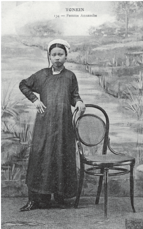
▲ Carte postale montrant une femme annamite accoudée à une chaise de style Thonet, vers 1900-1922. ▲ Postcard showing an Annamite woman, her hand resting on a Thonet-style chair, circa 1900-1922.