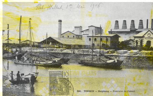
▲ Carte postale montrant une fabrique de ciment, Hải Phòng, 1906. ▲ Postcard showing a cement factory, Hải Phòng, 1906.

CHUYÊN SẢN XUẤT CÁC LOẠI XI MĂNG TRẮNG PROME - HẢI PHÒNG