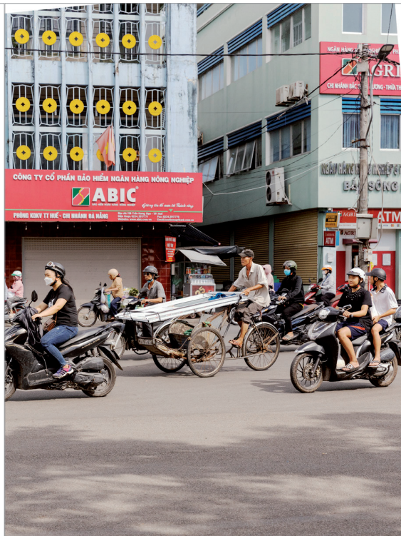
▲ Au milieu de la dense circulation des villes, il est fréquent de voir des xích lô transporter de volumineuses marchandises, Huế, 2023. ■ In the midst of dense city traffic, it is common to see xích lô carrying bulky goods, Huế, 2023.