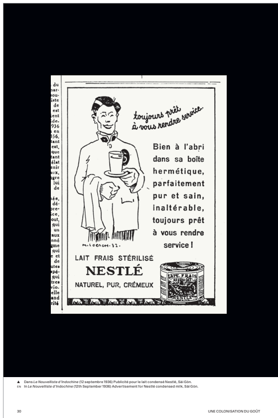
▲ Dans Le Nouvelliste d'Indochine (12 septembre 1936) Publicité pour le lait condensé Nestlé, Sài Gòn. ▲ In Le Nouvelliste d'Indochine (12th September 1936) Advertisement for Nestlé condensed milk, Sài Gòn.