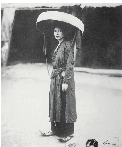
▲ Femme tonkinoise en tenue traditionnelle, Tonkin, 1926. ▲ Tonkinese woman in traditional clothing, Tonkin, 1926. ► Dans Báo Phong Hoá (Mars - Mai 1934) Illustrations de design de cols par Lemur Nguyễn Cát Tường, Hà Nội. ► In Báo Phong Hoá (March-May 1934) Illustrations of collar designs by Lemur Nguyễn Cát Tường, Hà Nội.

In Vietnamese, áo means 'top' and dài means 'long'. The expression áo dài refers to the long tunic that is also the prime traditional Vietnamese costume.