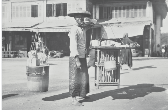
▲ Marchand de phở, Hà Phòng, 1920-1929. ■ Phở vendor, Hà Phòng, 1920-1929. ▲ Un marchand de soupe ambulante, Sai Gòn, 1897-1898. ■ Street soup vendor, Sai Gòn, 1897-1898